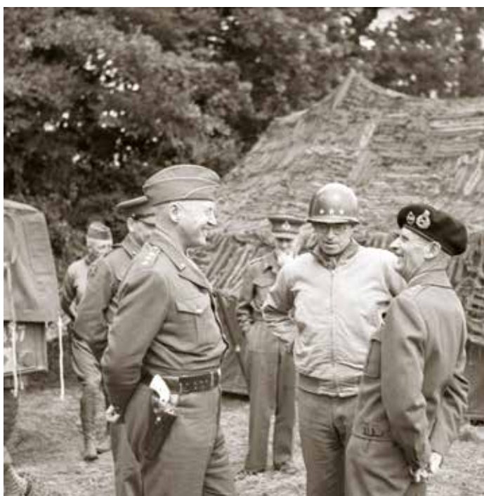
Nella foto: Patton, Bradley e Montgomery.