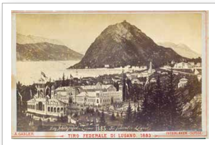
Cartolina del Tiro Federale Lugano, 1883