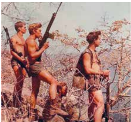
Nella foto: FN FAL – Guerra nella boscaglia rodesiana (oggi Zimbabwe) - 1975/1979

L'esercito francese, uscito dalla guerra, era equipaggiato con un misto di armi americane, francesi e tedesche catturate, il che non era certo economico. A partire dagli anni Cinquanta, introdusse una serie di armi robuste e di eccellente qualità, il fucile MAS 49/56, la mitragliatrice AA 52 e il PM MAT 49. Queste armi rimasero in servizio fino agli anni Ottanta, quando furono sostituite dal notevole FAMAS.