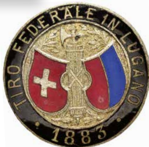
Tiro Federale Lugano, 1883