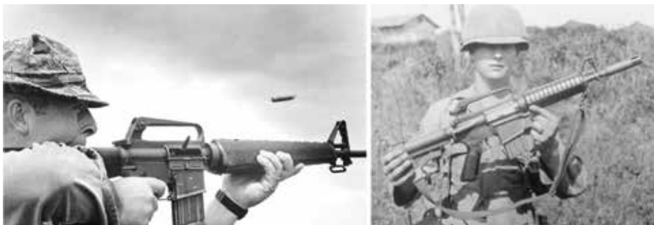
Nella foto: M16 e XM177 E (derivato dall'AR15) - Vietnam 1969