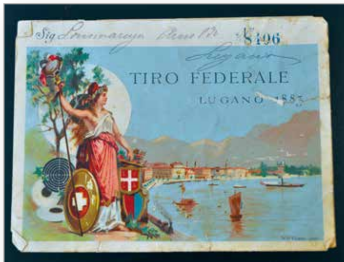
Tiro Federale Lugano, 1883