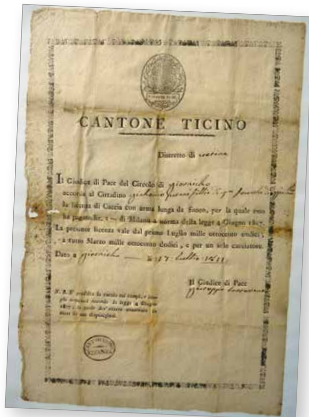
Patente di caccia, 1811