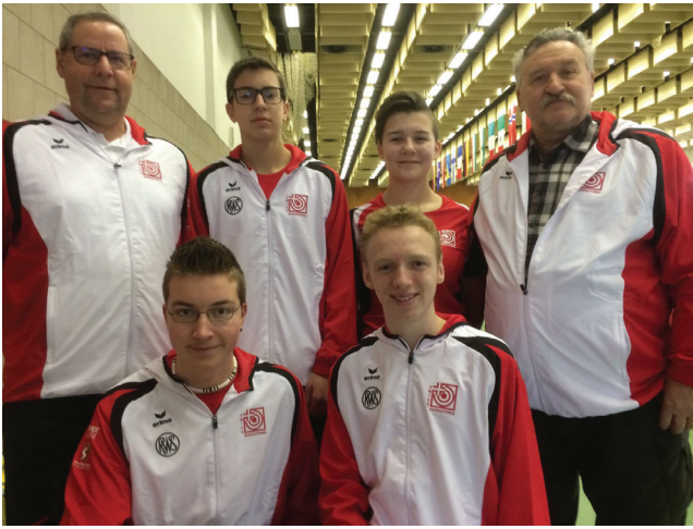
La delegazione svizzera a Pilsen.